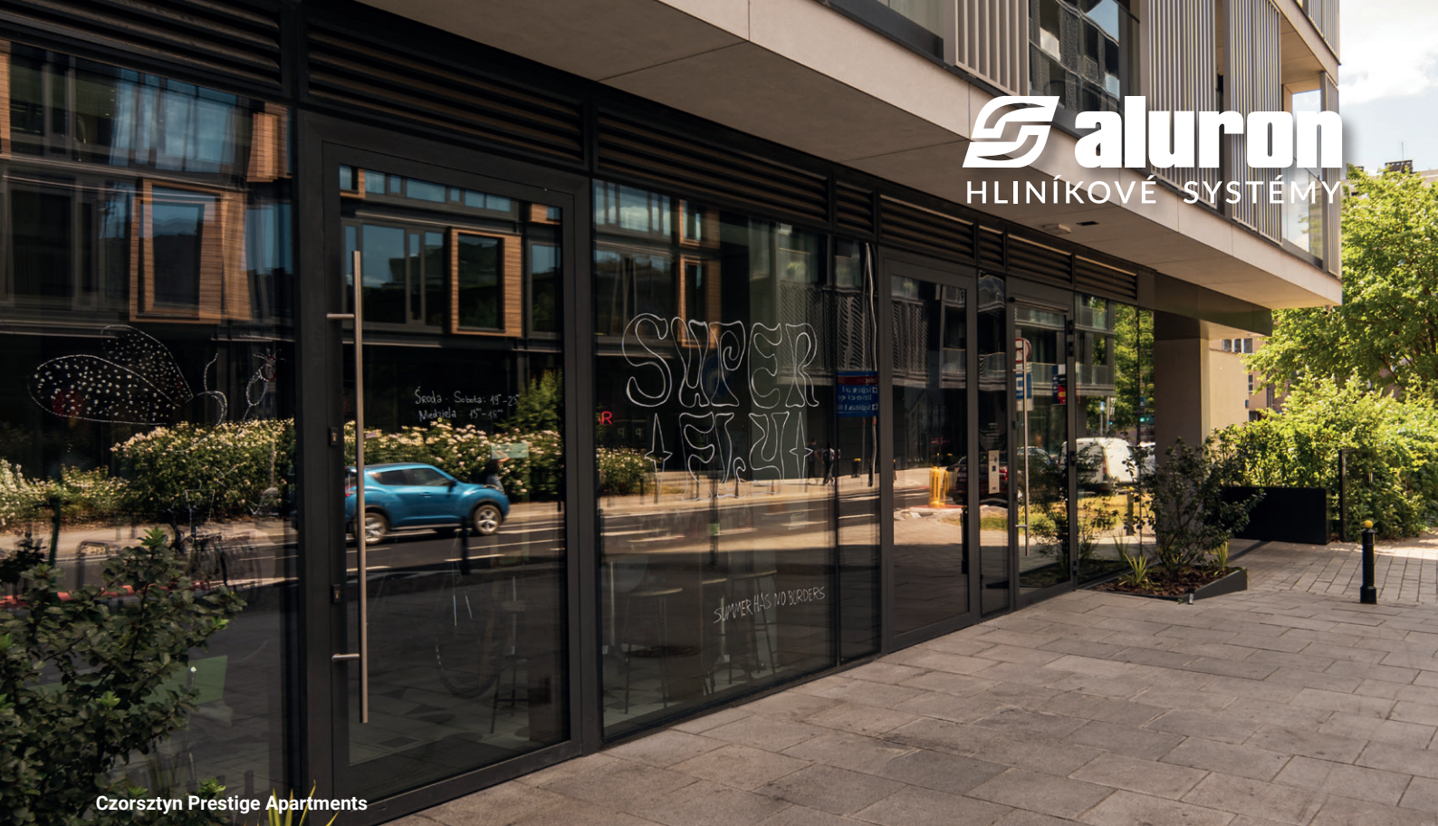
Czorsztyn Prestige Apartments